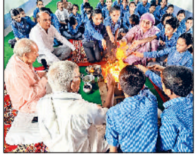
महम। मासिक हवन में आहुति डालते आर्य स्कूल मदीना के विद्यार्थी व शिक्षक। फोटो: हरिभूमि