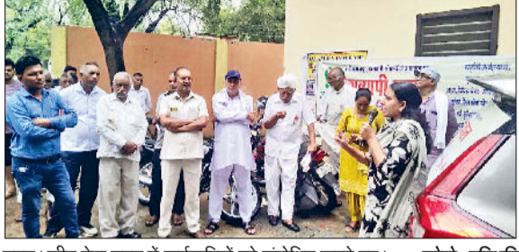
महम। सीटू नेता महम में कर्मचारियों को संबोधित करते हुए।