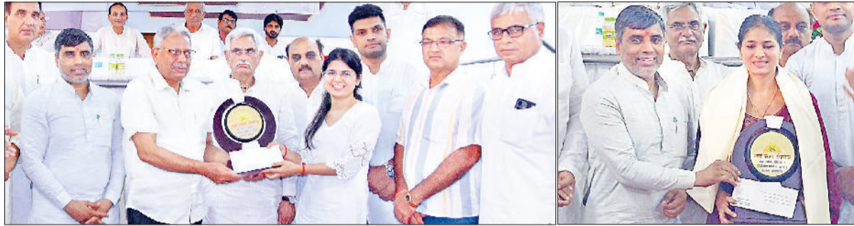
रोहतक। प्रशासनिक सेवा में चयनित समाज के अभ्यर्थियों को सम्मानित करते हरियाणा के शिक्षा मंत्री महिपाल ढांडा।