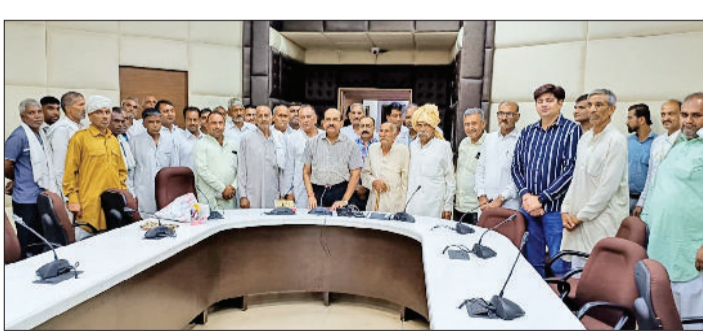
पीजीआईएमएस की नॉन टीचिंग एसोसिएशन ने भी दी बधाई