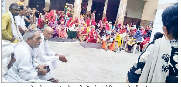
महम। महम क्षेत्र के एक गांव में ग्रामीणों को संबोधित करते सीटू नेता।

बीजेपी सरकार लगातार मजदूर, कर्मचारी व किसान विरोधी फैसले लेकर जनता में असंतोष पैदा कर रही है। उन्होंने कहा कि सभी गांव में मनरेगा का काम शुरू किया जाए और दिन व दिहाड़ी बढ़ाई जाए, निर्माण मजदूरों की सुविधाओं पर लगाई जाने वाली अनाप-शनाप शर्तों पर रोक लगाकर रोके गए लाभ जारी किए जाएं। रेशन डिपो में मिलने वाली सरसो तेल के रेट को बढ़ोतरी को वापिस लिया जाए। कहा कि भाजपा ने 5 साल पहले कारपोरेट-पूजीपतियों के हित में मजदूर विरोधी चार लेबर कोड पारित किए थे, जिन्हें अब लागू