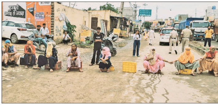
रोहतक। अपनी समस्या के लिए जींद बाईपास के नजदीक रोड जाम करते स्थानीय निवासी।

शहर की सड़कों की खस्ता हालत से परेशान जनता का गुस्सा सोमवार को फूट पड़ा। सुंदरपुर रोड पर गहरे गड़ों और सड़क की मरम्मत न होने से तंग आकर स्थानीय लोगों ने सुबह-सुबह रोड पर जाम लगा दिया। जाम के कारण सड़क पर यातायात पूरी तरह से बाधित हो गया और राहगीरों को भारी परेशानी का सामना करना पड़ा। ग्रामीणों का कहना था कि जींद बाईपास से सुंदरपुर की ओर जाने वाली सड़क कई महीनों से टूट चुकी है। जगह-जगह गहरे गड़ों से भरी हैं, जिनमें बरसात के मौसम में पानी भर जाता है। पानी भरने के कारण गड़ों नजर नहीं आते और दौड़ते-दौड़ते वाहन चालकों के गिरने की घटनाएं आम हो गई हैं। लोगों के अनुसार यहां एक-दो बार नहीं बल्कि कई बार गंभीर दुर्घटनाएं हो चुकी हैं, लेकिन नगर निगम और संबंधित विभाग आंखें मूंदे बैठे हैं।