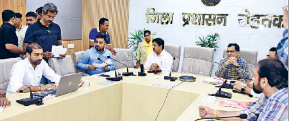
रोहतक। समाधान शिविर में लोगों की समस्याएं सुनते उपमंडलाधीश आशीष कुमार।

शिकायतों की सुनवाई करने के दौरान मौके पर संबंधित अधिकारियों को इन शिकायतों का यथासंभव उचित निपटारा करने के निर्देश दिए। उन्होंने कहा कि सरकार