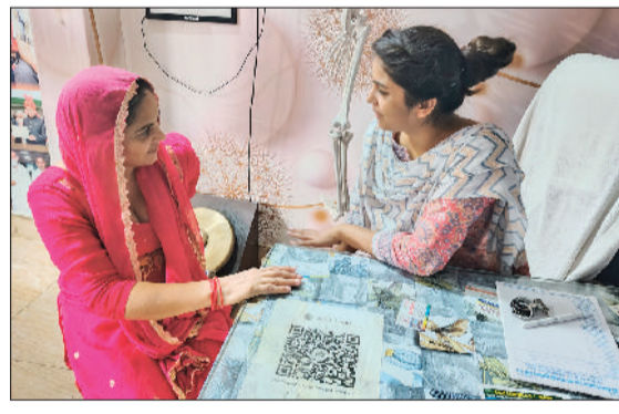
रोहतक। शिविर में मरीजों की जांच करते डॉक्टर।